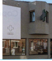
Pharmacie Obled 59320 Hallennes-lez-Haubourdin