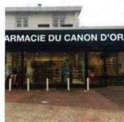
Pharmacie du Canon d'Or 59130 Lambersart