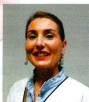
Auteur Charlotte Chatelain