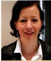
Auteur Audrey Hennuyer