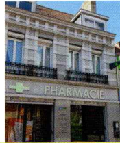
Pharmacie de La Poste 62100 Calais